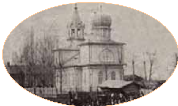
Село Копально, 1917 г.