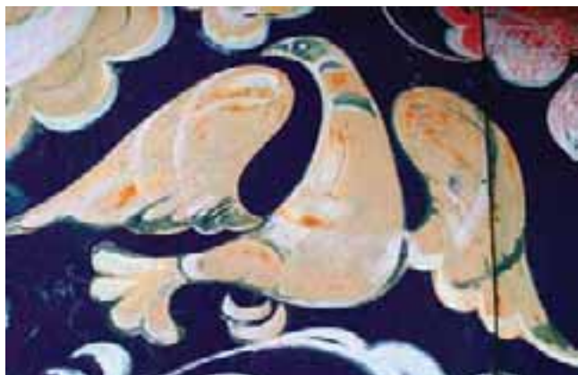
Фрагмент росписи дома

Вы станете свидетелями рождения в руках молодых мастеров-юношей чуда — сотворения «чусовского чеканного (тисненого) бурака» (так его зовут историки-искусствоведы) из берестяного сколотня. В нем ни молоко, ни квас не скиснут в любую жару, а сохраняют прохладу напитка благодаря «свойству термоса».