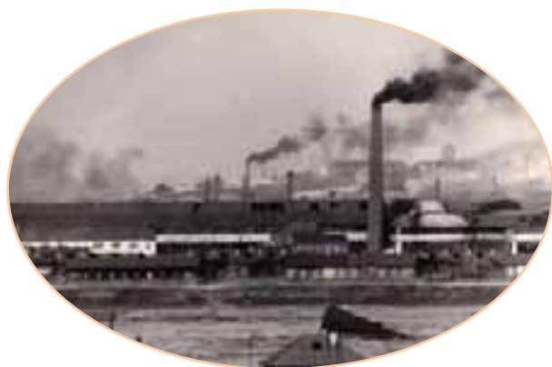
Вид на Чусовской завод, 1957 г.