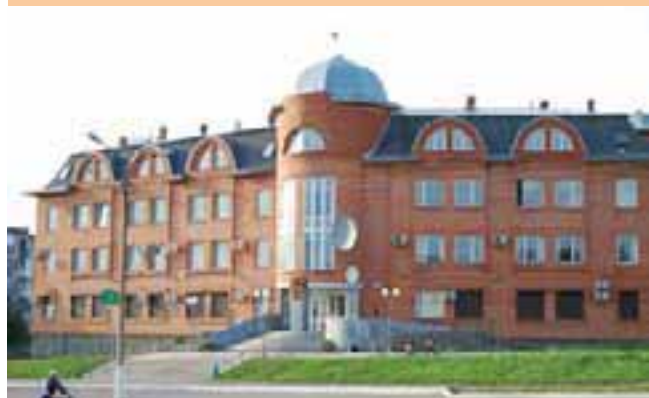
Здание администрации Чусовского района