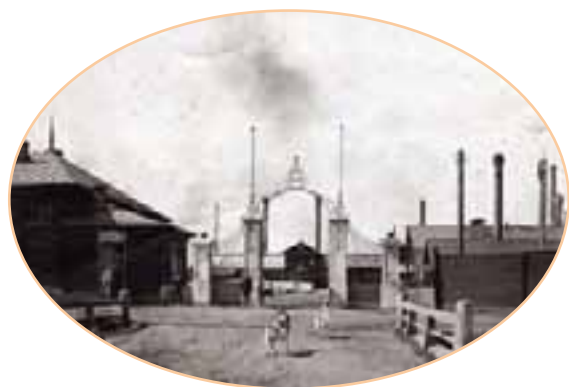
Проходная Чусовского завода, 1913 г.