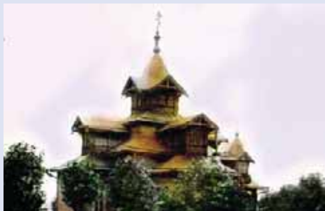
Ксеньевская церковь (начало XX в.)