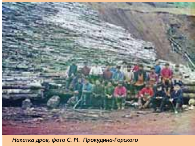
Накатка дров, фото С. М. Прокудина-Горского