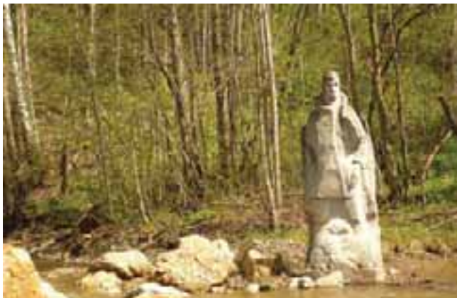
Памятник А. С. Грину