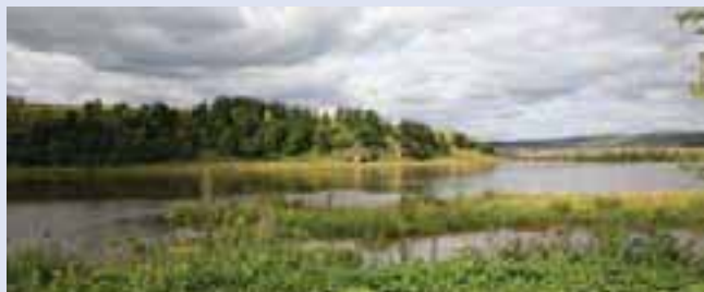
Калапова гора, слияние рек Усьва и Чусовая