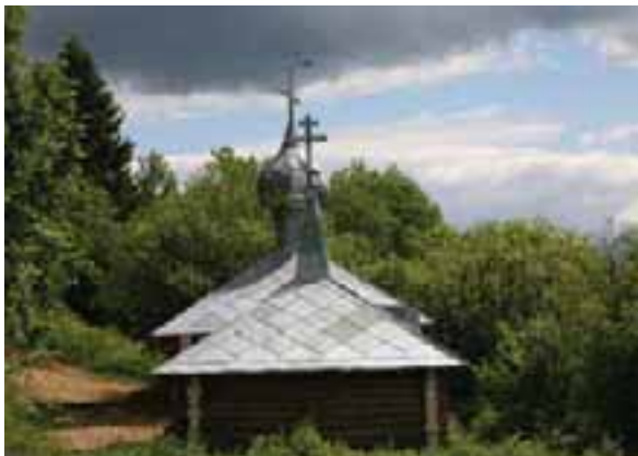
Источник Казанской Божией матери

В большинстве своем храмы строились на пожертвования прихожан и богатых меценатов. В сельской местности всем миром возводились деревянные храмы и часовни. Храм был местом красоты — именно там, среди прекрасных икон и фресок, находила приют и успокоение душа человека. Нередко здесь хранились особо чтимые иконы.