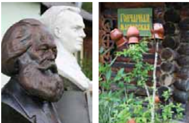
Этнографический парк истории реки Чусовой

р. Чусовой — музей Ермака, расположенный в специально построенной часовне со звонницей. В центре экспозиции данного музея — серия картин заслуженного художника России Павла Шардакова, посвященная походу Ермака в Сибирь из Нижнечусовских городков. Кроме этого, в музее выставлены на обозрение памятник Ермаку работы Юрия Злоти и макеты орудий, использованных в походе войском Ермака.