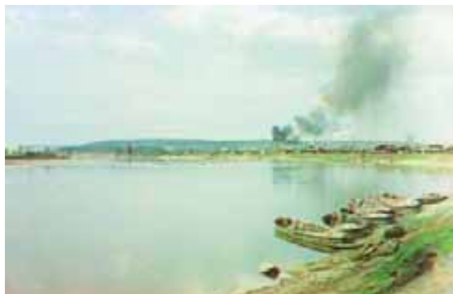
р. Чусовая