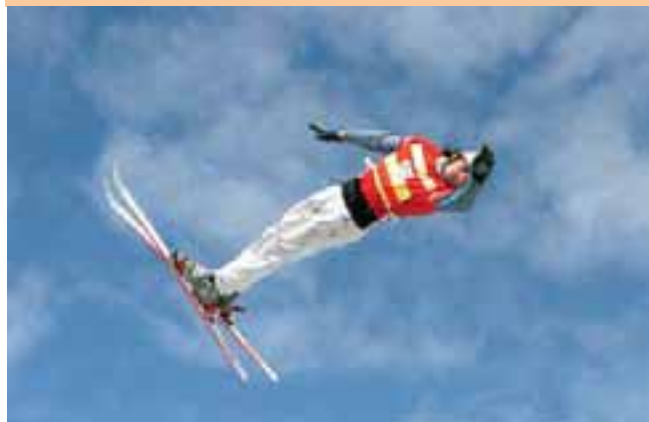
Чемпионат России по фристайлу