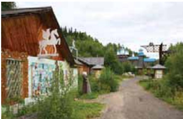
Этнографический парк истории реки Чусовой