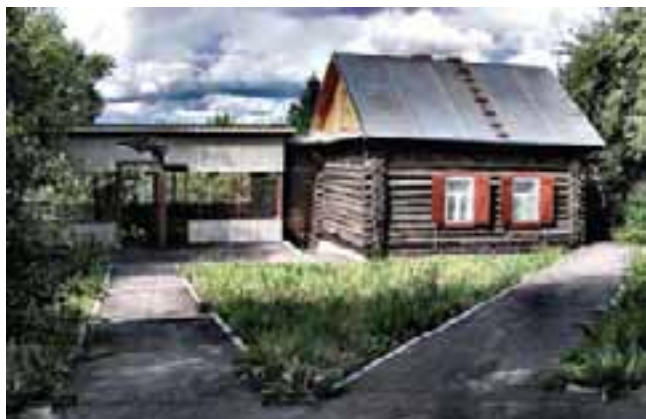
Дом В. П. Астафьева