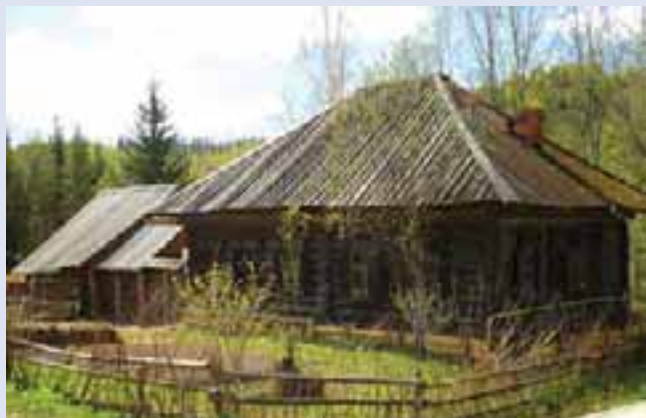
Этнографический парк истории реки Чусовой