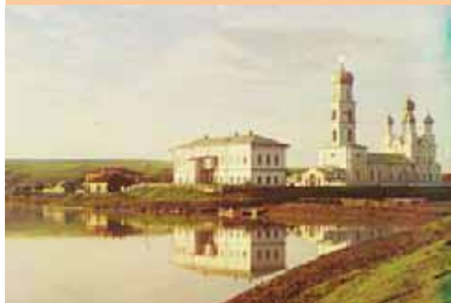
Дом Строгановых