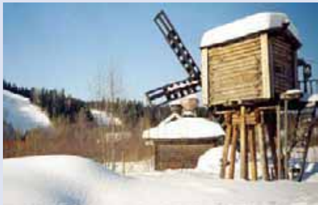
Этнографический парк истории реки Чусовой