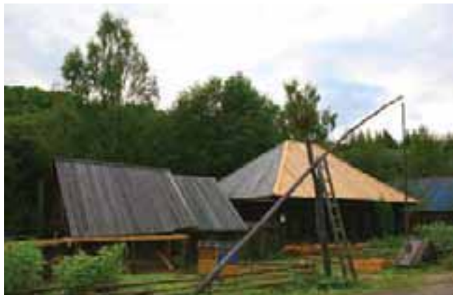
Этнографический парк истории реки Чусовой