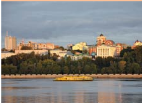
С реки город по-прежнему красив...