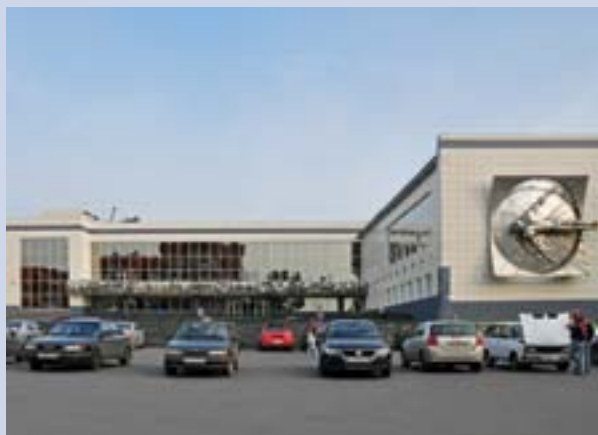
Дворец культуры им. Ю. А. Гагарина