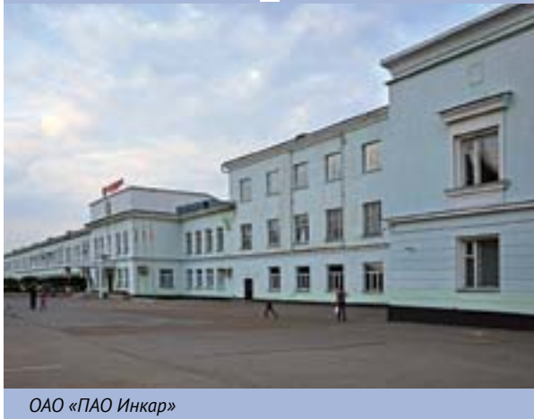
ОАО «ПАО Инкар»

5 Наш город уникален тем, что в одном регионе имелись ракетная дивизия (в Бершети), ракетное училище и головной ракетный завод. Военно-космическая техника пришла в Пермь в конце 1950-х годов. В процесс ее создания включились 19 предприятий, три из них — конструкторские бюро. Наибольшая ответственность легла, конечно, на заводы-гиганты — им. В. И. Ленина и им. Я. М. Свердлова. В музее оружия в Мотовилихе представлена ракета Р12, которую делали четыре предприятия. И только пермскому заводу доверили изготовить на ее базе ракету-носитель «Космос-2». Еще один музейный экспонат — это первая твердотопливная ракета, созданная под руководством С. П. Королева. В СССР было 11 сборочных заводов, а Мотовилихинскому заводу доверили изготовить первую в Советском Союзе ракету РС12. Другого такого завода нет, чтобы выпускал ракетную технику и на твердом, и на жидком топливе.