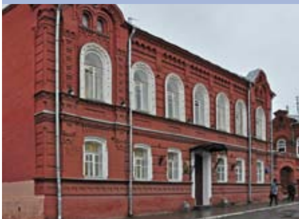
Ленинская районная администрация (дом купца Жирнова)