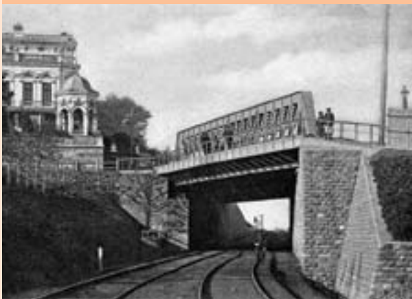
Дом Мешкова и железнодорожный переезд, нач. XX в.