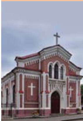
Приход Римско-католической церкви