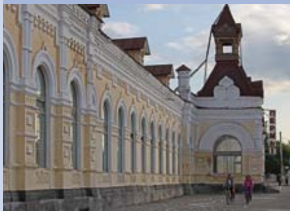
Вокзал Пермь I