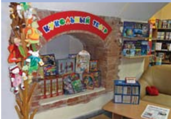
В подвале под бывшим домом купца Рязанцева (сейчас магазин и ресторан)

к речушке Данилихе и к тому месту, где когда-то стояла церковь (Николы Чудотворца на Слудке). Люк, ведущий в один из рукавов, прикрывала массивная каменная плита в металлической раме. Плита эта двигалась на роликах, а сам ход представляет собой облицованный кирпичом сводчатый коридор высотой около полутора метров, причем на полу (кирпичном) была проделана канавка.