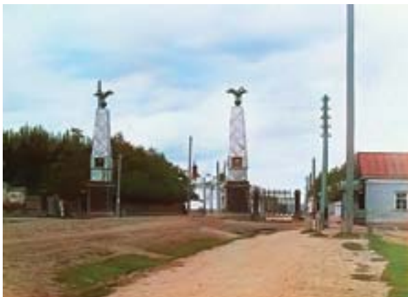
Сибирская застава, нач. XX в.