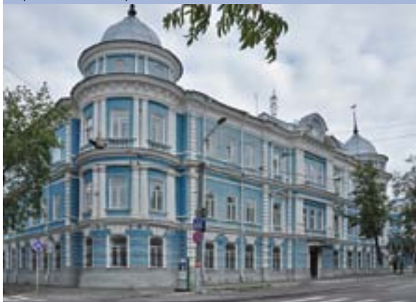
Управление ФСБ (дом Тупицыных)