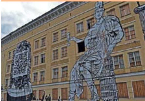
Здание бывшего Пермского высшего военного командно-инженерного училища им. маршала Чуйкова (ВКИУ)