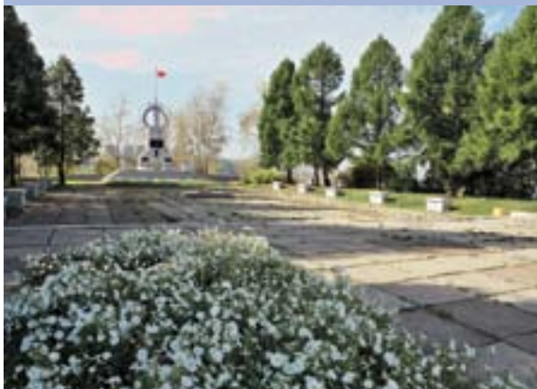
Царь-молот стал памятником революции

вожделенного, так сказать, внимания писателя-юмориста представляют пароходные меню. «...Ах, икра! Ем, ем и никак не съем. В этом отношении она похожа на шар сыра. Благо, не соленая... Стерляди дешевле грибов, но скоро надоедают...» (24 апреля 1890, пароход «Кама»).