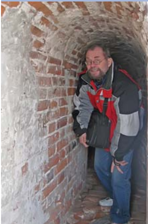
Вдруг откуда ни возьмись...

тельствует тот факт, что со второй половины XVIII века здесь появилось кладбище. И до сих пор сохранились склепы— семейные захоронения купцов Агафуровых, потомственных почетных граждан Смышляевых и др. Однако никакой критики не выдерживает версия пермских диггеров о том, что от Успенской (Старокладбищенской) церкви через пещерный храм и по склепам можно было пройти под самым кладбищем, через систему подземных ходов-сообщений. Надо знать, что пещерный храм располагается не слева и в стороне от церкви, а под самим храмом. И, кроме того, склепов на Егошинском кладбище очень немного, такие захоронения могли позволить себе только очень состоятельные, и не в одном поколении, люди. Что подтвердилось во время раскопок и реставрационных работ в склепе отца и сына Смышляевых, открытом под Всехсвятской (Новокладбищенской) церковью в 2004 году.