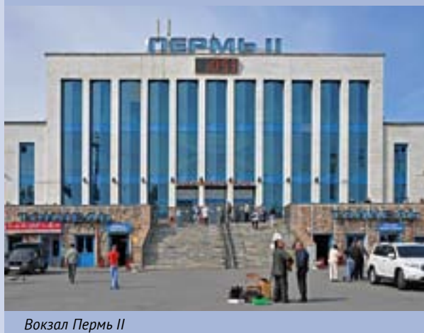
Вокзал Пермь II