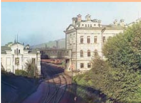
Здание управления железной дороги, нач. XX в.