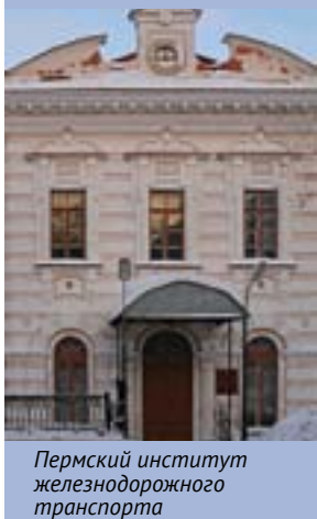
Пермский институт железнодорожного транспорта