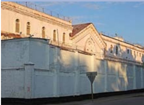
Тюремный замок в Разгуляе