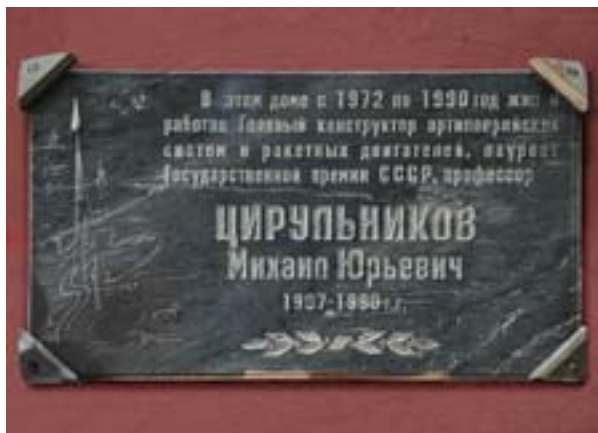
Мемориальная доска М. Ю. Цирульникову