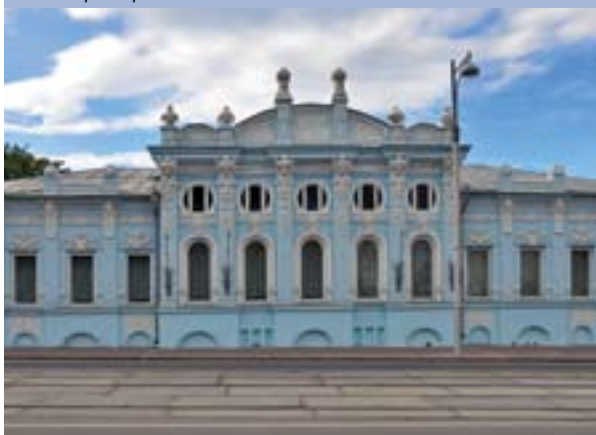
Пермский научный центр УрО РАН (дом купца Грибушина)