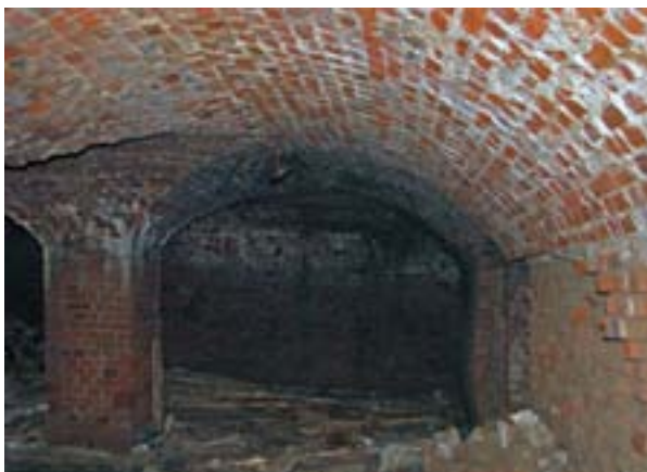
Подвал за домом горсовета