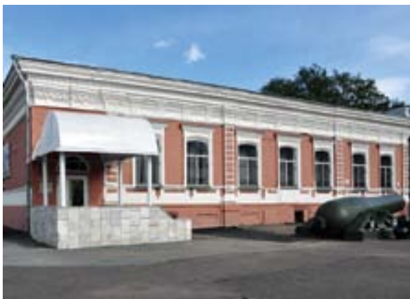
Музей Мотовилихинского завода