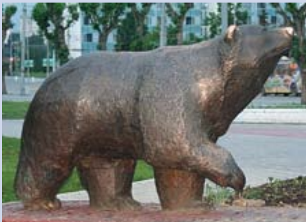
Скульптура «Легенда о пермском медведе»