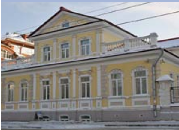
ОАО Собинбанк (дом купца Гаврилова)