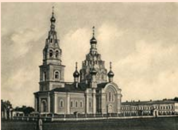
Церковь Вознесения, нач. XX в.