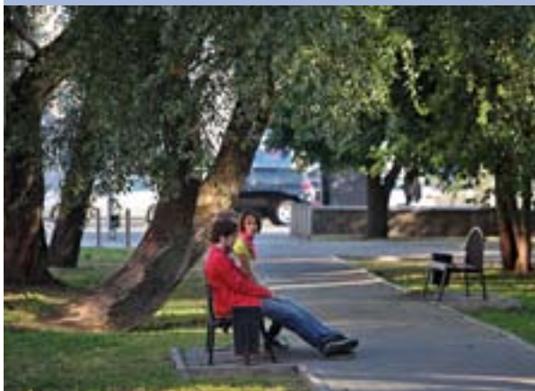
Сквер Уральских добровольцев (бывший Черный рынок)