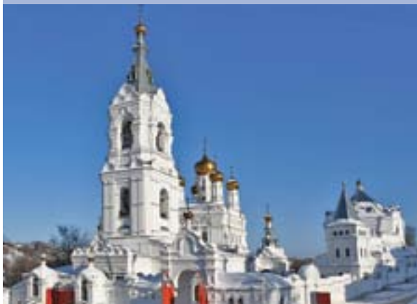
Пермский Свято-Троице Стефанов мужской монастырь