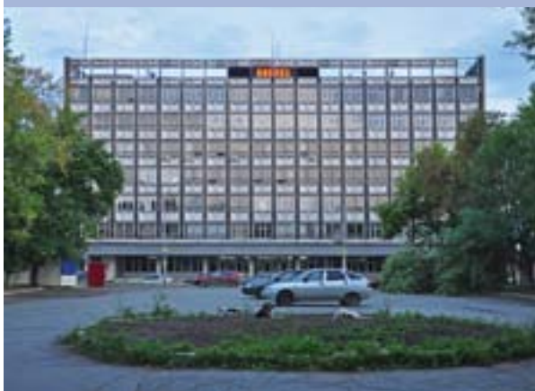
ОАО «Пермские моторы»