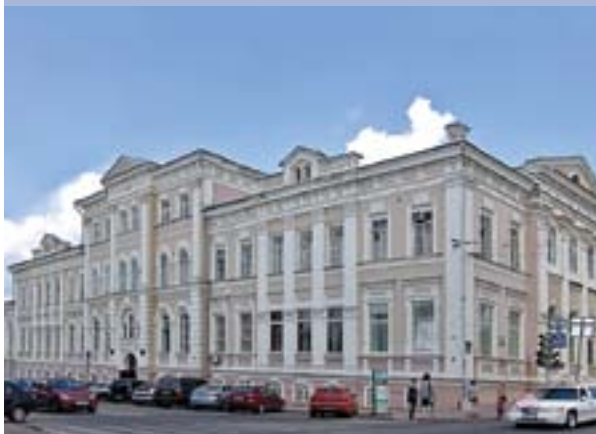
Бывшее духовное училище. Арх. Р. О. Карвовский