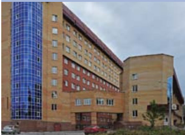
Краевая клиническая больница