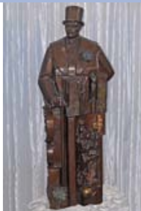
Памятник С. П. Дягилеву