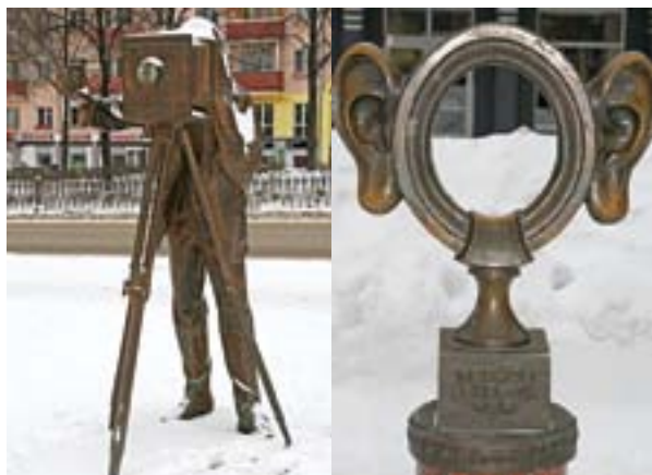
Скульптурная композиция «Пермяк-солёны уши»