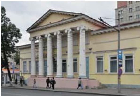
Клуб ГУВД им. Ф. Э. Дзержинского (бывшее Благородное Собрание)