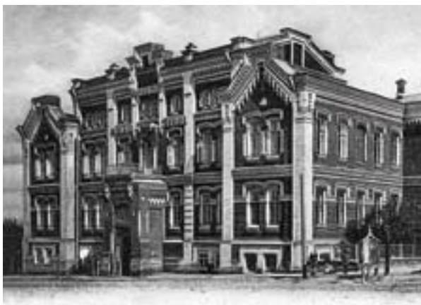
Здание Мариинской женской гимназии, нач. XX в.