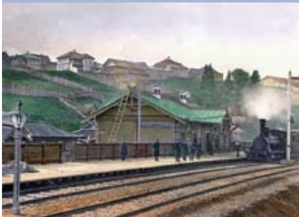
Станция Мотовилиха, нач. XX в.