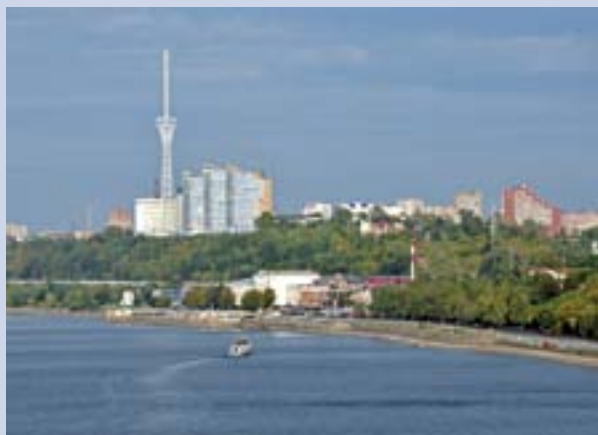
Вид на речной вокзал