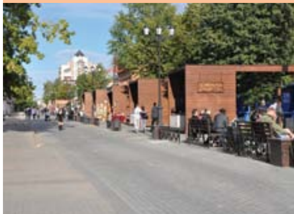
Пешеходная часть ул. Кирова

своего знаменитого земляка поэта Василия Каменского. Действовала по классическому принципу: бить по самому заметному, «коль музыка — так барабан!».