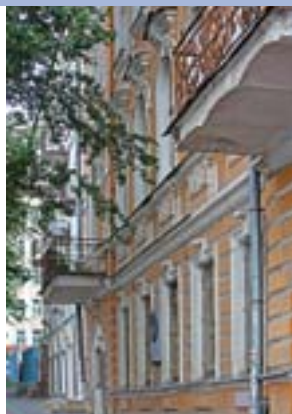
Бывшая гостиница «Королевские номера»

ского, небесного покровителя М. А. Романова. Часовня поставлена на предполагаемом месте захоронения Михаила (микрорайон Чапаевский, ул. Целинная). Кончина великого князя, воина и правителя, была истинно праведной и мученической, поэтому в Перми ежегодно проходят крестные ходы и Романовские исторические чтения.