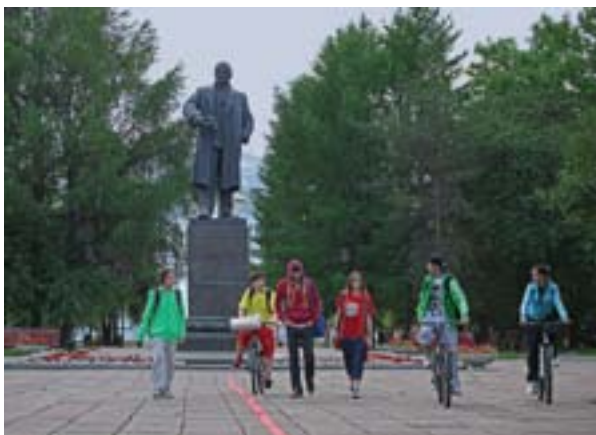
Театральный сквер, памятник В. И. Ленину