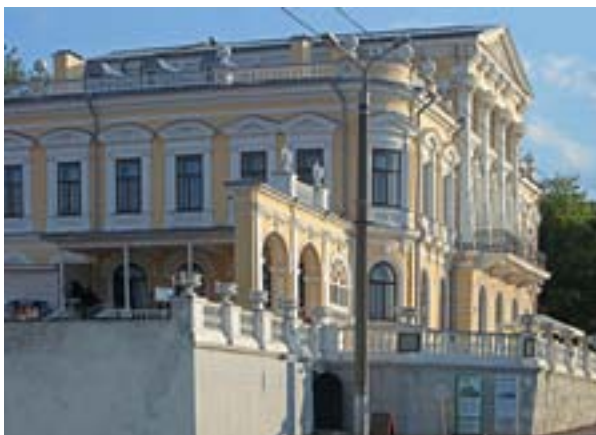
Дом Мешкова. Арх. А. Турчевич