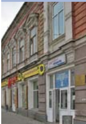
Бывший дом Алиных