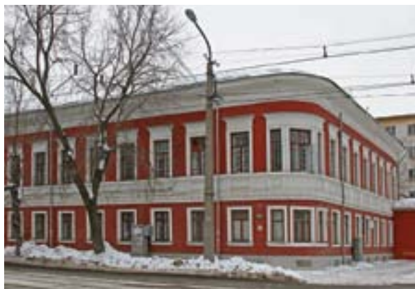
Пермское медико-фармацевтическое училище (бывшая гимназия сестер Циммерман)