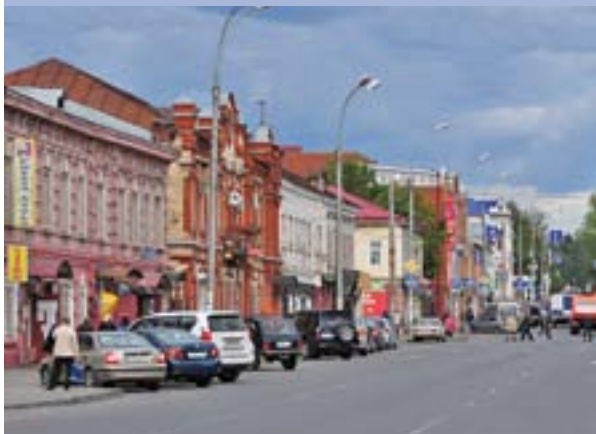
ул. 1905 года