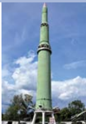
Экспонат музея Мотовилихинского завода