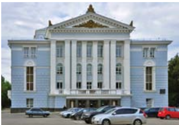
Пермский государственный академический театр оперы и балета им. П. И. Чайковского