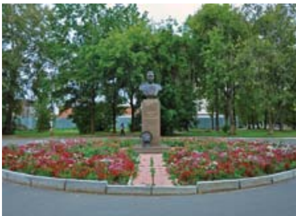
Бюст А. Г. Солдатов