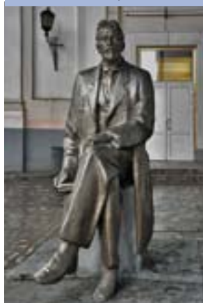
Памятник А. П. Чехову

стоявшей по соседству с Дворянской гостиницей. Однажды, услышав церковный благовест, Чехов вдруг с некоторой грустью произнес: «Вот любовь к этому звону—все, что осталось еще у меня от веры». Приехав в первый раз на Урал, пишет: «Колокола звонят великолепно, бархатно...» (29 апреля 1890). Любил беседовать с духовными лицами и внешне всегда соблюдал обрядность. «Строю колокольню», — сообщает он в одном из писем. Будучи на Урале, Чехов участвует в молебне по случаю открытия и освящения новой школы во Всеволодо-Вильвенском заводе.