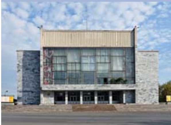
ДК им. Кирова

и выполняющие космические заказы. В Кировском районе это ФКП «Пермский пороховой завод» (бывш. НПО ФГУП «Завод им. С. М. Кирова»). В музее, расположенном во Дворце культуры (ул. Кировоградская, 26), собраны воспоминания ветеранов-пороховщиков, других специалистов, показаны предметы, виды продукции, ставшие уникальными экспонатами, ранее недоступные простым смертным. Отражена роль и специалистов, ранее строго засекреченных персон. Известно, что главный конструктор космических кораблей Сергей Королев несколько раз приезжал в Пермь. Он руководил подготовкой испытательных полетов как беспилотных кораблей, так и с животными на борту. Кстати, в музее другого города Пермского края, Чайковского, демонстрируются части спускаемого аппарата (крышка люка и др.), оставшиеся после приземления беспилотного космического корабля, место пилота занимал «Иван Иванович» — манекен в скафандре. Случилось это событие 25 марта 1961 года, то есть всего за несколько недель до полета человека в космос.