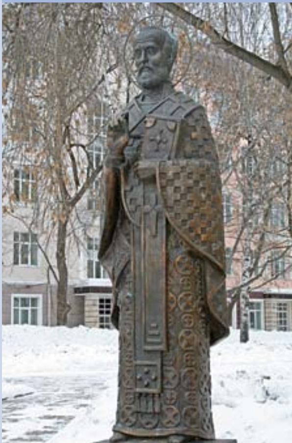
Памятник Святому Николаю Чудотворцу