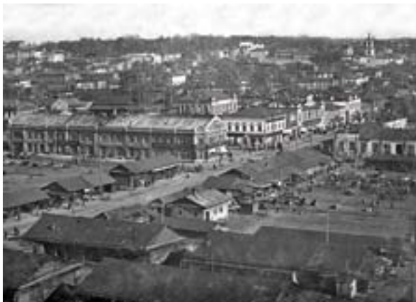
Черный рынок (фото 1920-х)