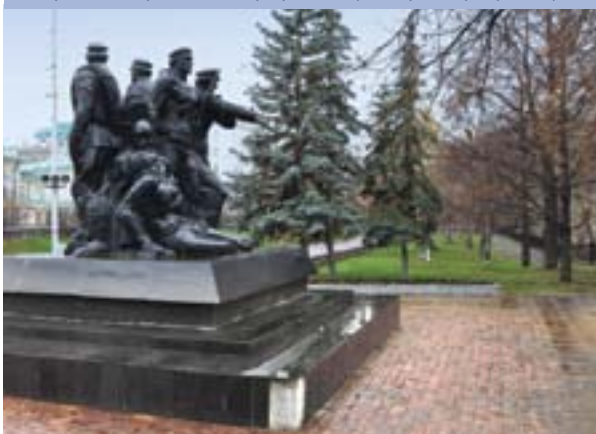
Сквер им. Решетникова (бывший «Козий загон»)

Пермский театр связан с чеховским творчеством столь тесно, что мог бы посоперничать в этом отношении с некоторыми столичными театрами. Пьесы Чехова шли на этой сцене еще при жизни автора. Местные газеты подробно освещали каждую постановку, горячо, заинтересованно обсуждали успехи и провалы. Журнал «Искусство и жизнь», выходящий в Перми в 1910-е годы, завлекал на чеховскую премьеру. Впрочем, реакцию жителей тогдашней Перми на постановку по пьесе «Три сестры» можно было предугадать. В лучшем случае — недоумение, к которому примешивалось, скорее всего, чувство оскорбления. Подтверждение этому есть в пермских газетах той поры.