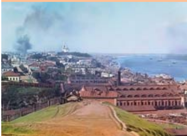
Панорама Перми с Красной горки, нач. XX в.