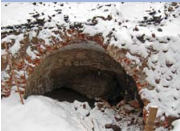
Подземелье во дворе дома Мешкова