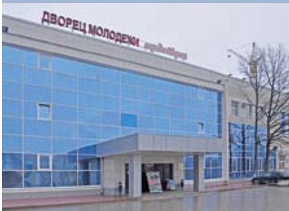
Дворец молодежи Пермского края