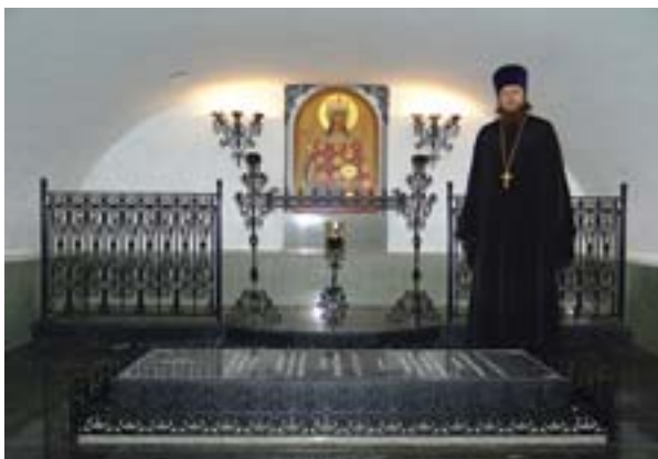
В семейном склепе почетных граждан Смышляевых под Всехсвятским храмом