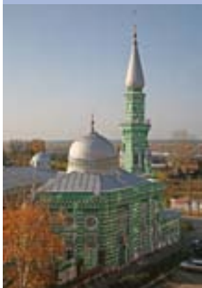
Соборная мечеть. Арх. А. Ожегов