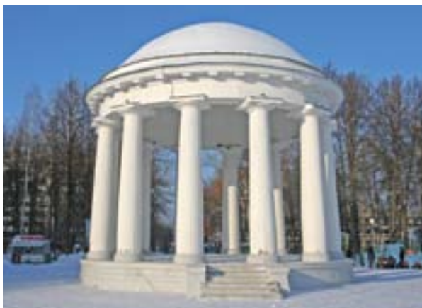
Ротонда в парке им. Горького (бывший Загородный сад)