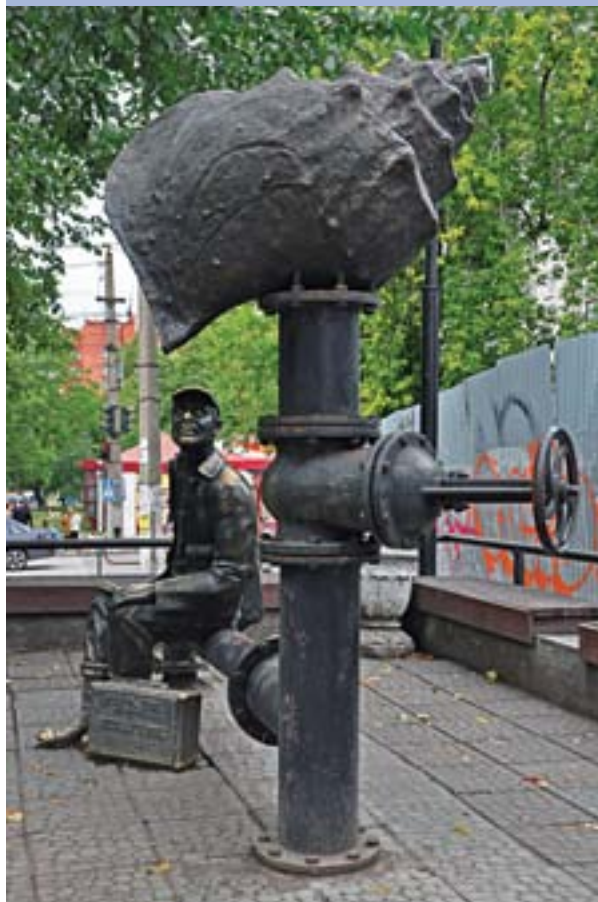
Скульптурная композиция «Водопроводчик»