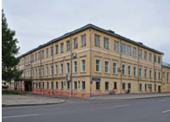
Пермский авиационный техникум им. А. Д. Швецова