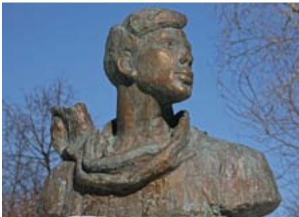
Памятник Борису Пастернаку