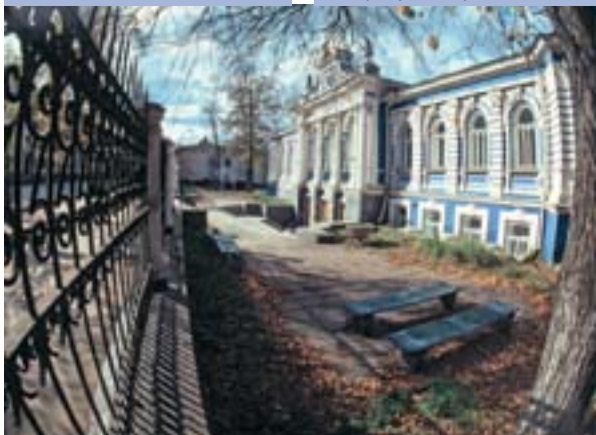
ТЮЗ (дом Любимовой). Арх. А. Турчевич

Бесспорно, к лучшим образцам живописного модерна относится дом Грибушина (ул. Покровская, ныне Ленина, 13). Воспетый поэтами «дом с фигурами» интересен и своими интерьерами: в помещении сохранились «родные» камины, лепнина, зеркала... Спустя сто лет современному зодчему Михаилу Футлику удалось создать прекрасный образчик здания в стиле модерн, «дорисовав» портрет заповедной улицы Сибирской, той ее части, что расположена ниже театрального сада (ул. Сибирская, 4). Возник опять же любопытный диалог нашего современника с прошлым. Не случайно эта постройка М. Футлика представлена на международном сайте лучших зданий мира с таким комментарием: «Очень приятно гулять по городу и рассматривать строения, которые не попадают под определение стандартных прямоугольников, не имеющих индивидуальности и лица».