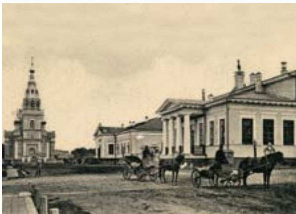
Воскресенская церковь, Благородное собрание, нач. XX в.