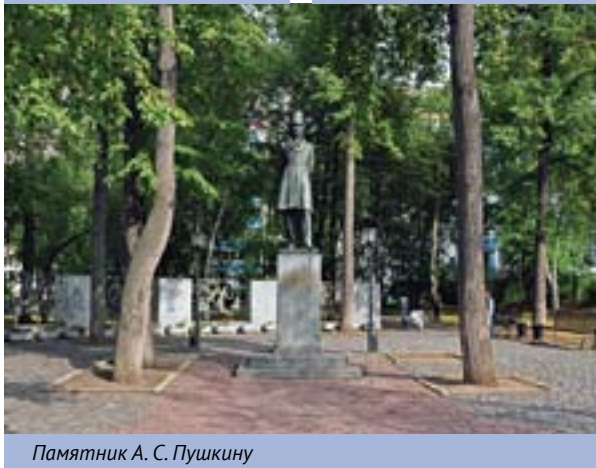
Памятник А. С. Пушкину