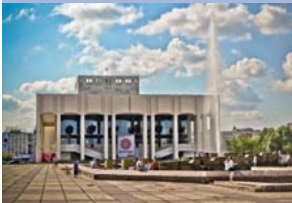
Пермский академический театр «Театр». Арх. В. П. Давыденко и В. И. Лютикова