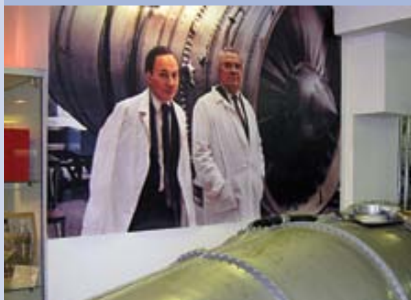
Музей истории пермского моторостроения