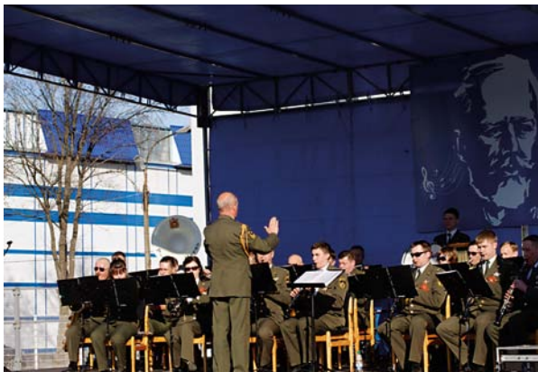
Концерт Пермского Губернского оркестра, посвященный дню рождения П. И. Чайковского