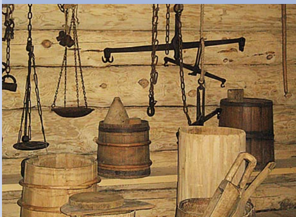
Фрагмент экспозиции «Клеть»