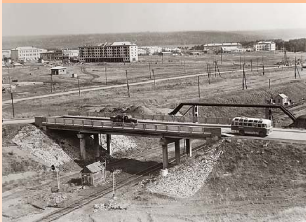
Первые улицы г. Чайковского