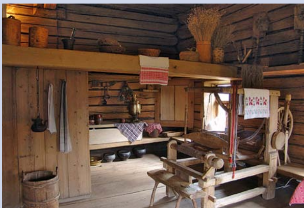
Интерьер избы крестьянина-старообрядца кон. XVIII – нач. XIX вв.