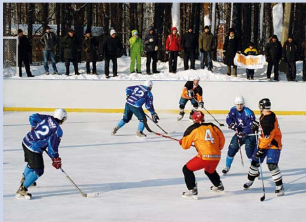
Соревнования по хоккею