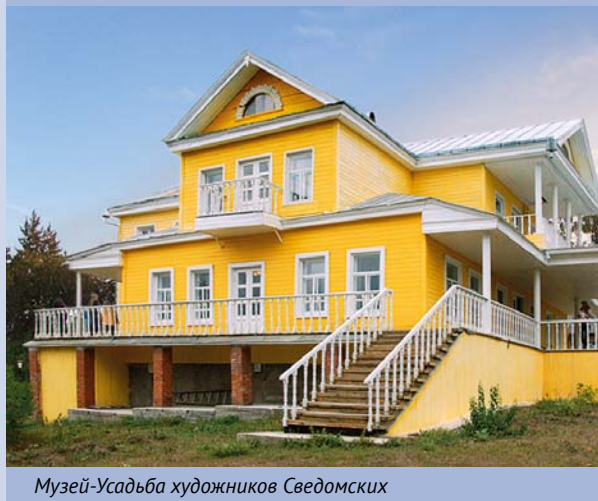
Музей-Усадьба художников Сведомских