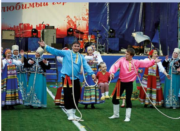
Праздничный концерт в День города