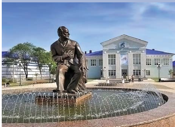
Площадь П.И. Чайковского. Памятник композитору

фестивального движения детского и юношеского музыкального творчества. Установлена на средства предприятий города: завода «Стройдеталь», завода синтетического каучука, ремонтно-механического завода, завода «Точмаш», управления строительства «Воткинскгэсстрой», комбината шелковых тканей.