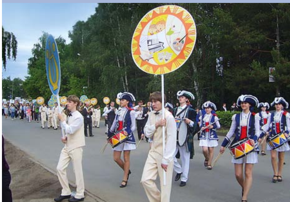
Международный открытый конкурс молодых композиторов, 2010 г.