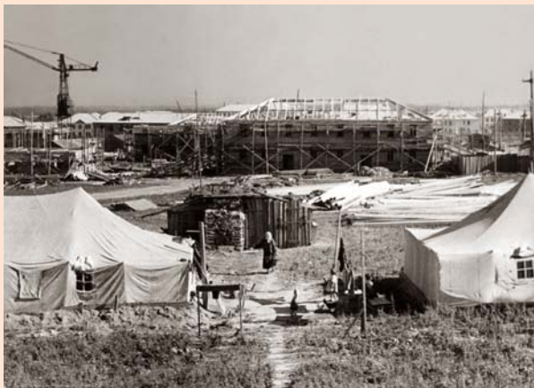
Строительство поселка Чайковский