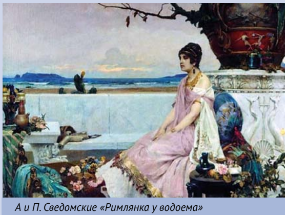
А и П. Сведомские «Римлянка у водоема»

ским участвовали в росписи Владимирского собора в Киеве. Живописные работы Павла отмечались медалями Императорской Академии художеств, работа «Жаки. Сцена из времён французской революции» получила золотую медаль на Всемирной выставке в Париже в 1889 году. За одну из своих работ Павел Сведомский награждён орденом Станислава III степени. Сегодня картины Сведомских можно увидеть в музеях Москвы, Санкт-Петербурга, Киева, Омска, Казани, Перми, Саратова и других городов. Наиболее известные работы находятся в собрании Третьяковской галереи. П. М. Третьяков лично приобрёл у Павла Сведомского «Медузу» (1882г.), «Крестьянский двор» (1883), у Александра — «Улицу в Помпее» (1882г.), «На берегу Тибра» (1887г.).