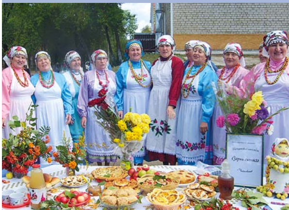
Ансамбль «Золотая осень» на празднике «Яблочный Спас»