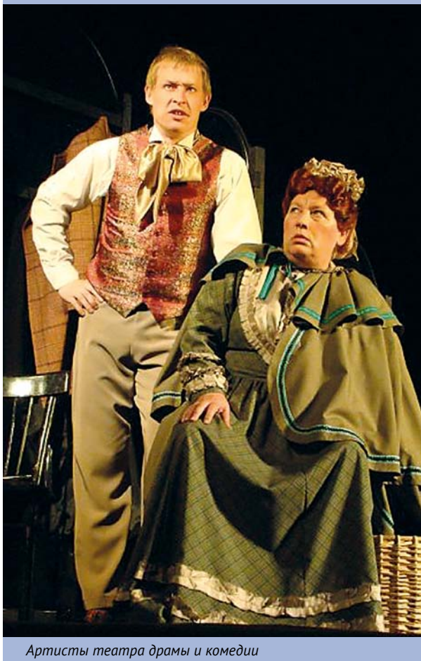
Артисты театра драмы и комедии