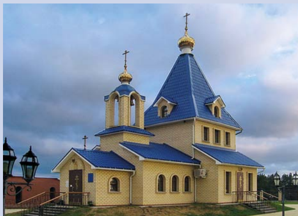
Храм Успения Пресвятой Богородицы