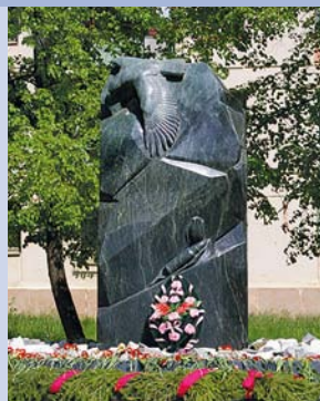
Обелиск воинам, погибшим в Афганистане, Чечне и других локальных военных конфликтах