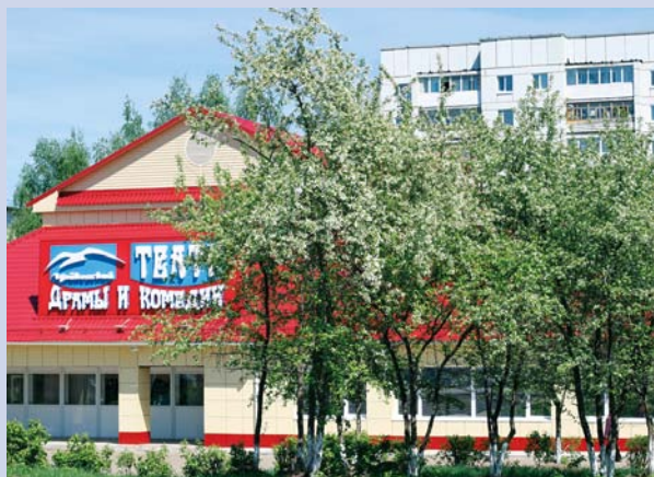
Чайковский театр драмы и комедии