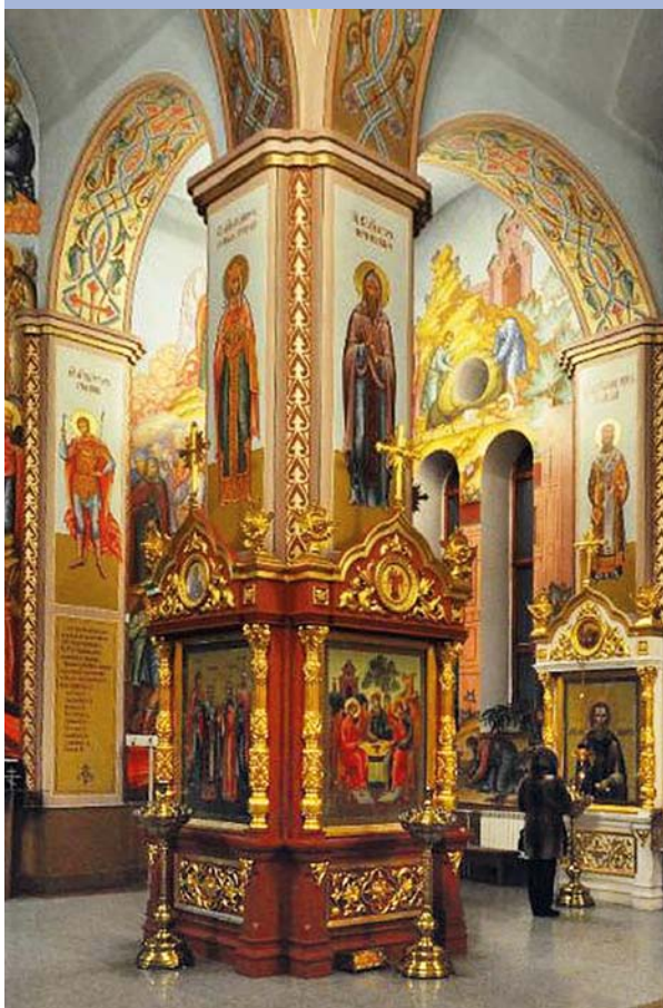
Внутреннее убранство храма Георгия Победоносца

ненный из белого мрамора с гранитным подножием. 19 января 2009 года по благословению Иринарха, епископа Пермского и Соликамского, был совершен первый великий чин освящения воды в построенной часовне святителя Николая Чудотворца. С этого дня начал действовать святой источник. Вода из артезианской скважины проходит двойную очистку и, попадая на серебряный крест, подается всякому желающему испить ее.