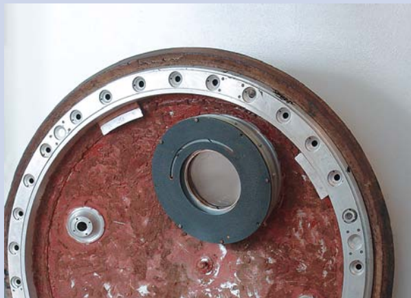
Крышка люка космического корабля