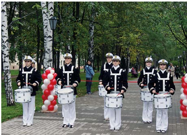
Открытие обновленного сквера на ул.Ленина