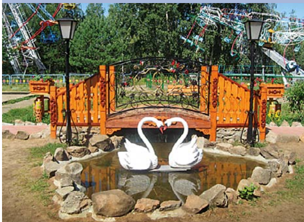
Парк культуры и отдыха