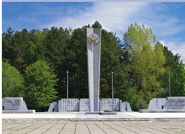
Мемориал Славы на Площади Победы