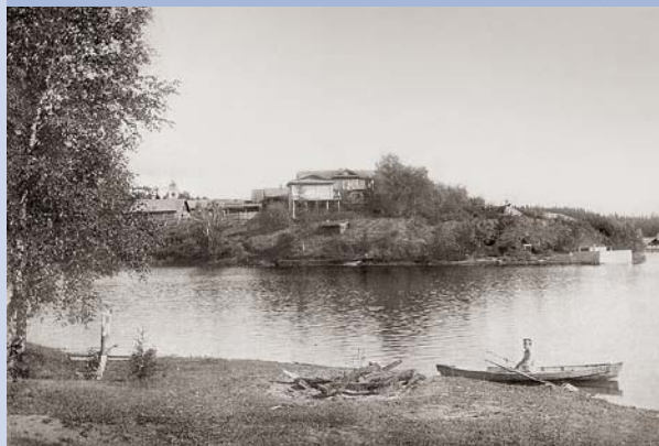
Вид на усадьбу с противоположного берега пруда