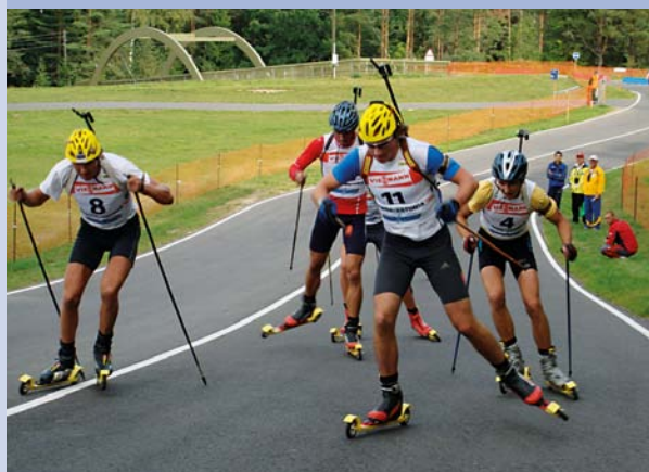
Тренировка на новом биатлонном комплексе