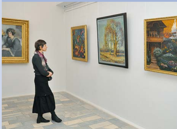
Экскурсия в выставочном зале художественной галереи