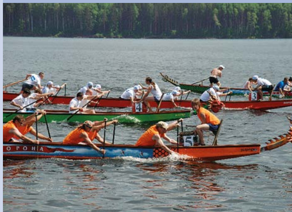
Соревнования на лодках класса «Дракон»