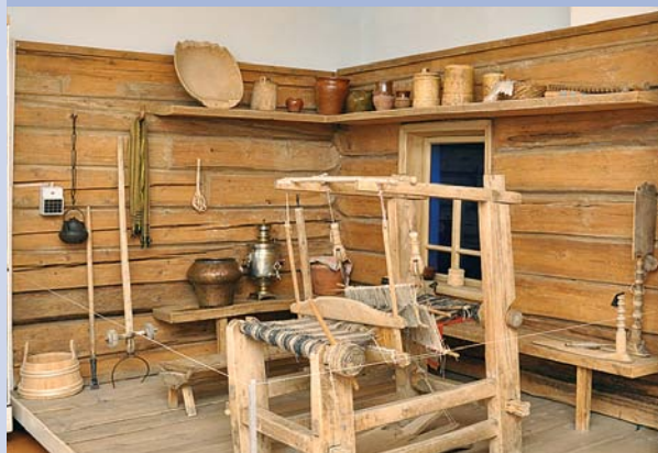
Фрагмент экспозиции «Крестьянский быт», кон. XIX – нач. XX вв.

ла I», принадлежащий кисти неизвестного художника, который выполнен на высоком профессиональном уровне, эффектен по своим живописным приемам.