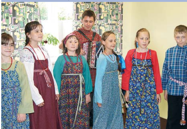
Фольклорный ансамбль «Барбушка» Детской школы искусств № 1

приняли участие в 30 конкурсах различного уровня.