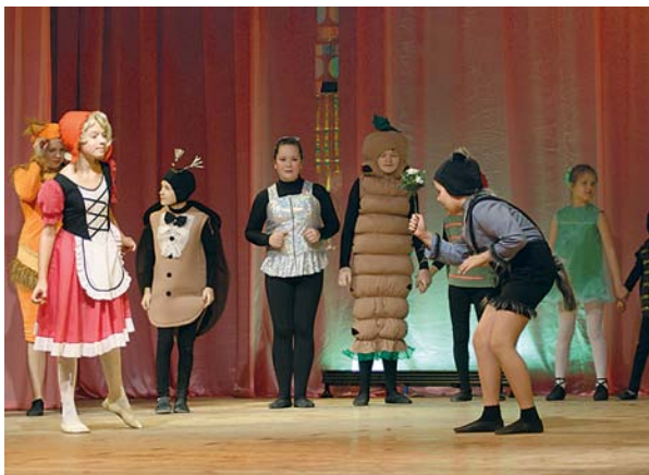
Юные артисты ТЮЗа Дворца Молодежи