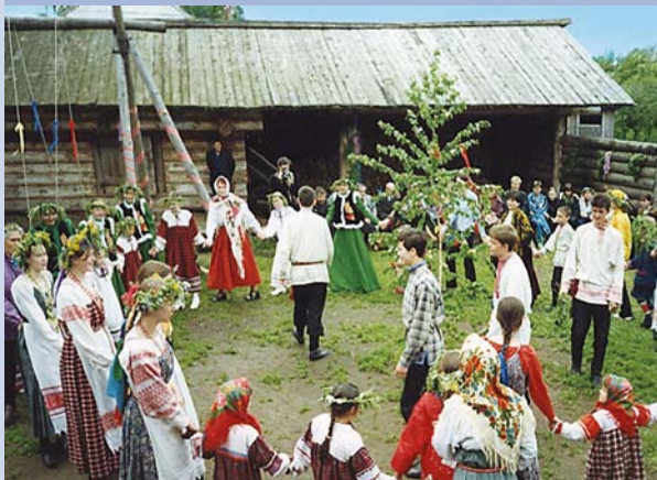
Календарный праздник Троица в музее-усадьбе