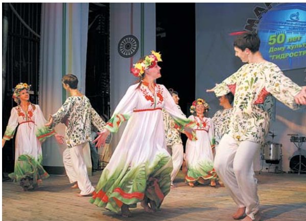
Выступление коллектива Культурно-спортивного центра