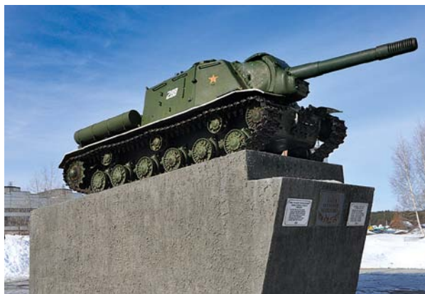
Самоходная артиллерийская установка на площади Уральских танкистов