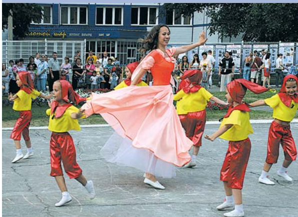
Выступление коллектива Культурно-спортивного центра