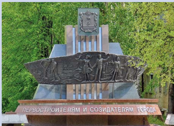
Памятник первостроителям и создателям города