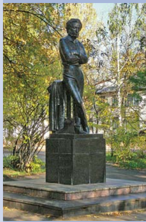
Памятник А. С. Пушкину