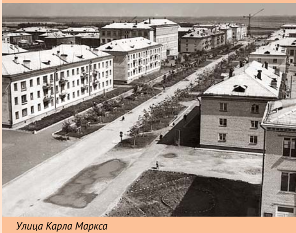
Улица Карла Маркса