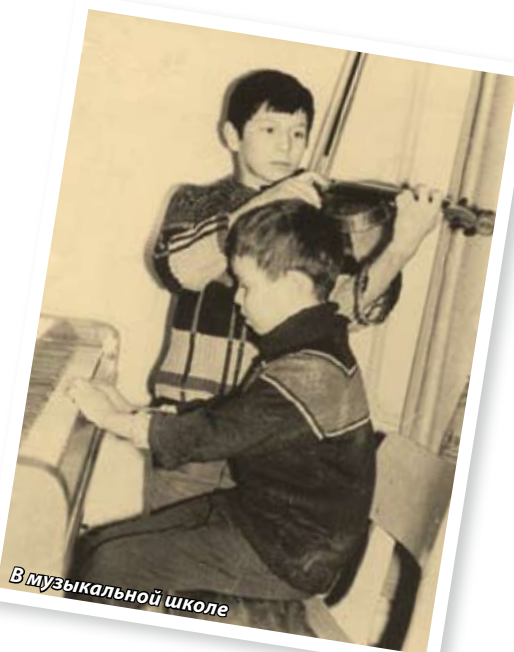
В музыкальной школе

Время моего детства было довольно хулиганистым. Однажды я шел в кинотеатр, зажав в ладошке 10 копеек, а недалеко от кассы такую малышню, как я, уже поджидала тройка парней постарше, чтобы, как это называлось, «зажать» и отнять деньги. Я, конечно, сопротивлялся, отстаивая не столько гривенник, сколько собственное достоинство, но в драке монету потерял. Естественно, в кино не ходил, планы сорвались... Но страшнее было ощущение несправедливости, вообще, это происшествие меня буквально потрясло. Дома я рассказал о случившемся отцу. Офицер и настоящий мужчина, он, выслушав меня, сказал: «Учись бороться за собственную честь; когда вырастешь, возможно, придется отстаивать и жизнь, причем не только свою, но и жизнь детей и близких».