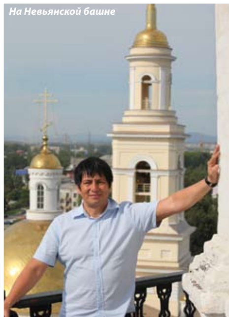
На Невьянской башне

состояния, позволяющего ощущать себя свободными людьми. Они путешествуют по свету, занимаются любимым делом и, что особенно важно, помогают городу.