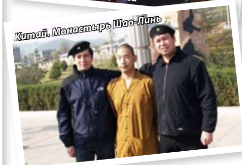
Китай. Монастырь Шао-Линь

В музыкальной школе, которая сейчас стала школой искусств, преподавала мама, там я учился по классу скрипки; в лыжную секцию спортивной школы я пришел тоже сам, а вот заняться боксом заставили обстоятельства.